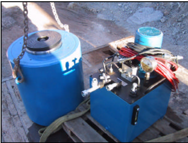
Equipo de carga de hasta 12000 kN