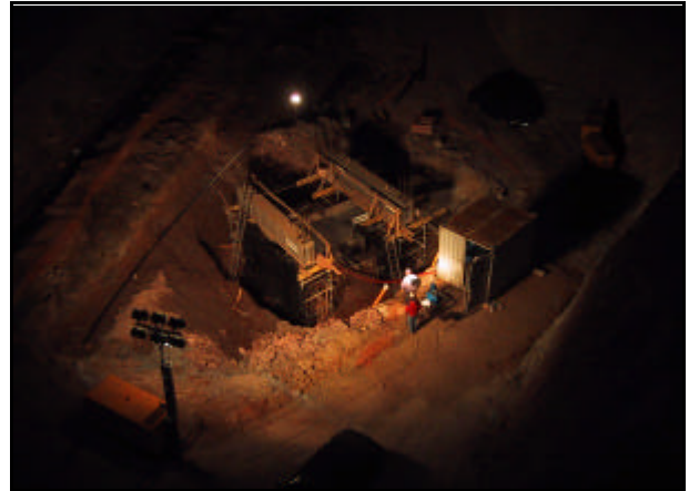
Ejecución nocturna de un ensayo