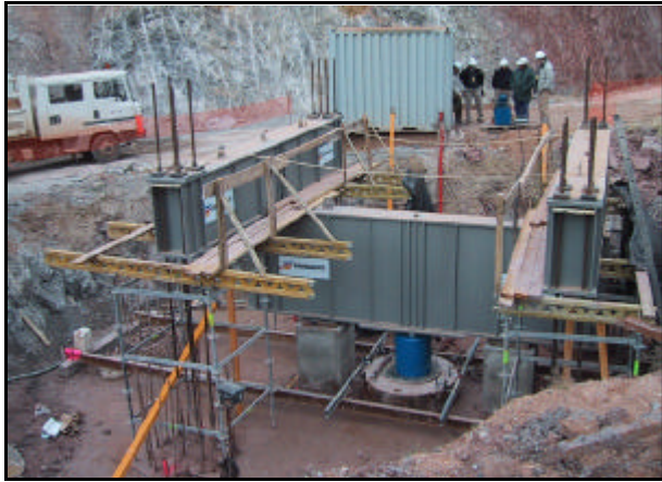
Marco de reacción