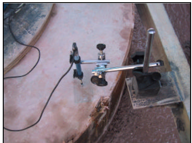
Detalle de los sensores de desplazamiento