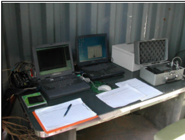
Equipo de control electrónico de toma continua de datos